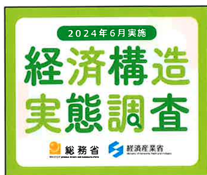
300 × 250 px